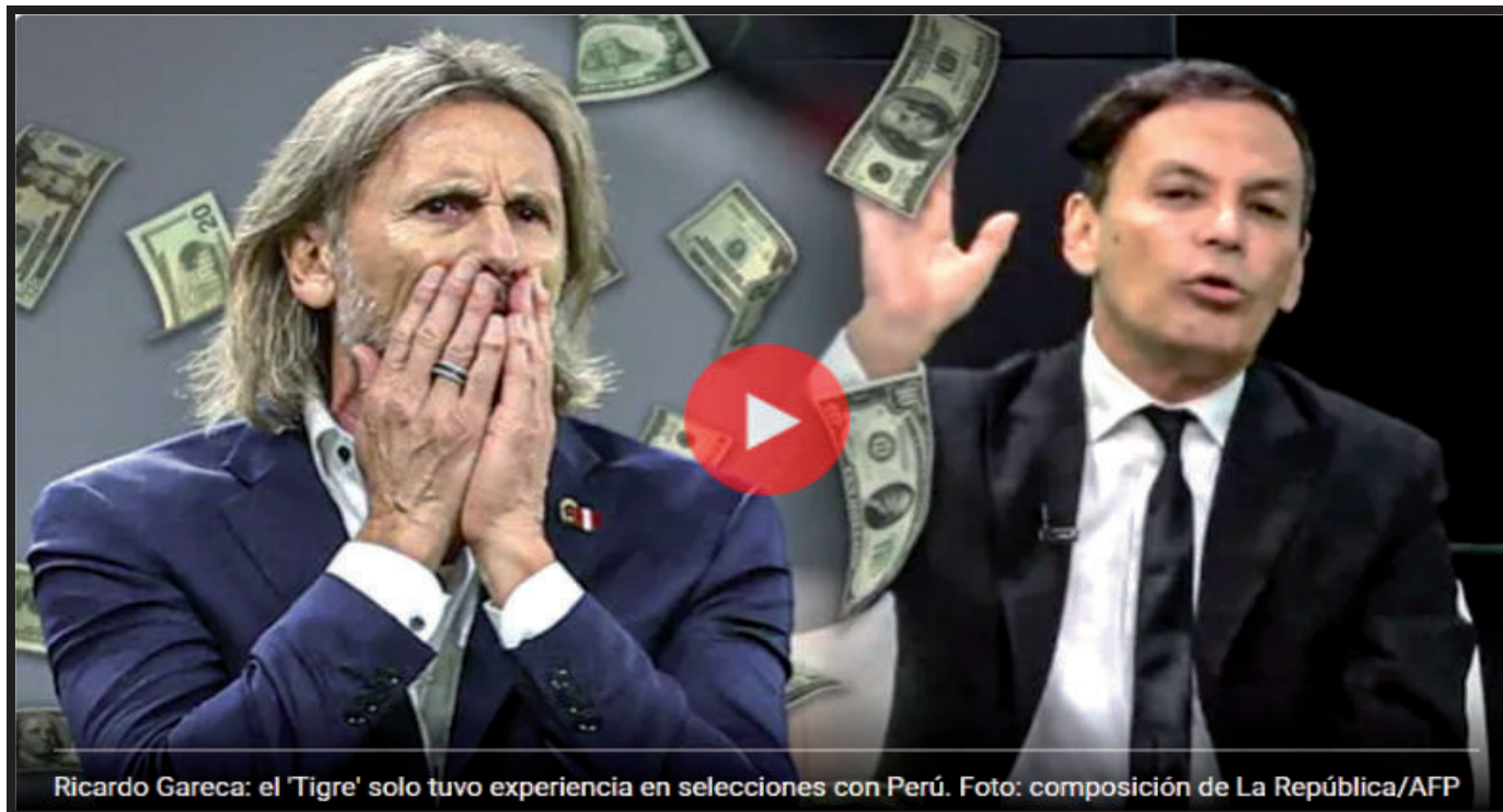
Ricardo Gareca: el 'Tigre' solo tuvo experiencia en selecciones con Perú.

Tras no llegar a un acuerdo con Ecuador, el periodista Ricardo Bonafont acusó al exentrenador de la selección peruana de recibir dinero del Gobierno peruano.