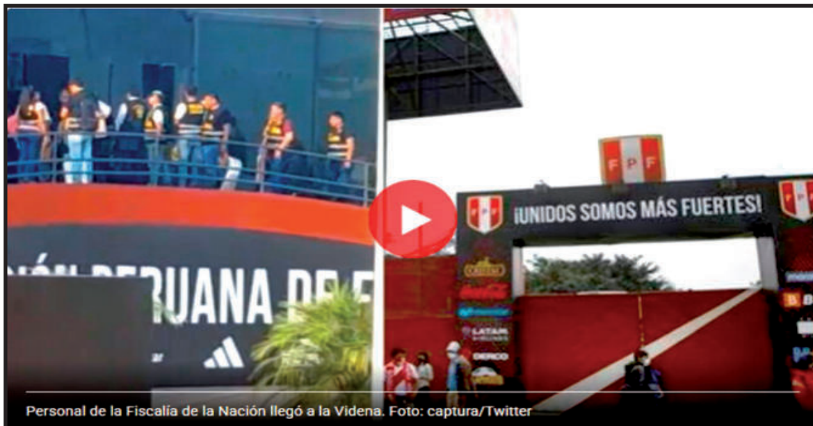
Personal de la Fiscalía de la Nación llegó a la Videna.

Diligencia se da en el marco de la investigación que lleva a cabo la Fiscalía en contra de Agustín Lozano por presunta organización criminal.